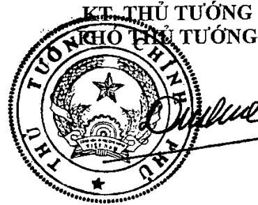
Vương Đình Huệ

Các Bộ trưởng, Thủ trưởng cơ quan ngang bộ, Thủ trưởng cơ quan thuộc Chính phủ, Chủ tịch Ủy ban nhân dân tỉnh, thành phố trực thuộc trung ương; Liên minh Hợp tác xã Việt Nam, Chủ tịch Hội đồng quản lý Quỹ Hỗ trợ phát triển hợp tác xã và các tổ chức, cá nhân khác có liên quan chịu trách nhiệm thi hành Quy chế này./.