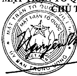
Nguyễn Thiện Nhân

TM. ĐOÀN CHỦ TỊCH ỦY BAN TRUNG ƯƠNG MẶT TRẬN TỔ QUỐC VIỆT NAM CHỦ TỊCH